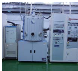
光学真空薄膜形成装置 Optical vacuum thin film deposition equipment