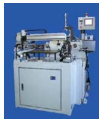
镜片芯取机 Lens centering machine