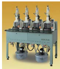
小口径高速镜片球面研磨机 High-speed lens smoothing, polishing machine