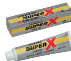
接着用 For bonding