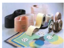
超精密研磨製品 High precision lapping product