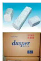
擦拭纸 Wiping paper