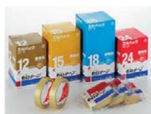
透明胶带 Scotch tape