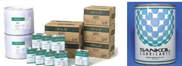
摩擦用快干润滑油 Friction-reducing, fast drying lubricant and grease