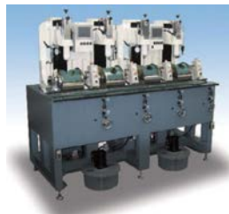
小口径高速镜片球面研磨机 High-speed lens smoothing, polishing machine