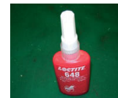
螺钉锁用 For screw lock