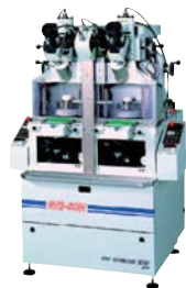
小口径镜片球面研磨机 Lens curve generator